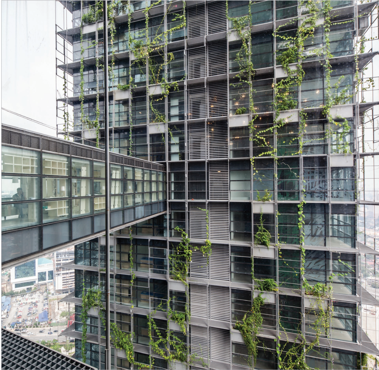
[34층 - Sky Bridge 전경]